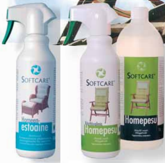
Softcare Antimøgelmedel 500 ml Softcare Møgeltvätt 500 ml Softcare Møgeltvätt 1 L (konzentrat)