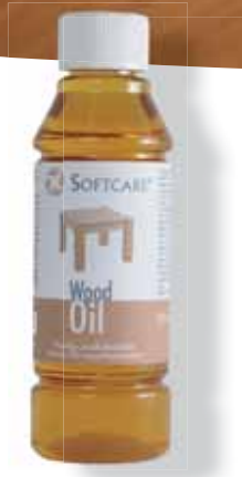
Softcare Wood Oil för inomhusmöbler 250 ml