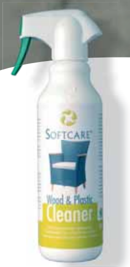
Softcare Wood & Plastic Cleaner 500 ml